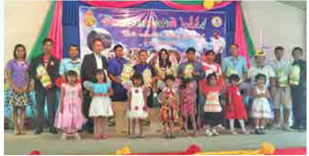
โครงการกิจกรรมวันเด็กแห่งชาติ ประจำปี 2559