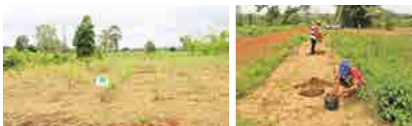
โครงการปรับปรุงภูมิทัศน์ ศูนย์บริการถ่ายทอดเทคโนโลยีการเกษตร ประจำตำบลสระตะเคียน