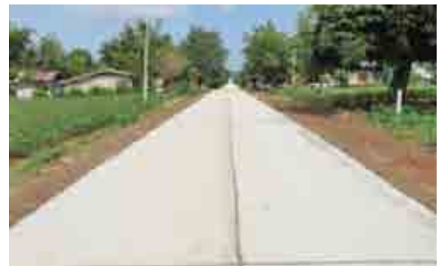
โครงการก่อสร้างถนนคอนกรีตเสริมเหล็กบ้านคลองศรีสุข หมู่ที่ 9