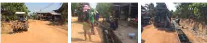
โครงการก่อสร้างรางระบายน้ำบ้านสระตะเคียน หมู่ที่ 1