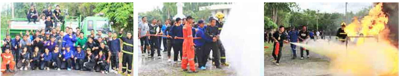
โครงการฝึกอบรมหลักสูตรอาสาสมัครป้องกันภัยฝ่ายพลเรือน (อปพร.) รุ่นที่ 4