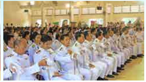
วันปิยมหาราช