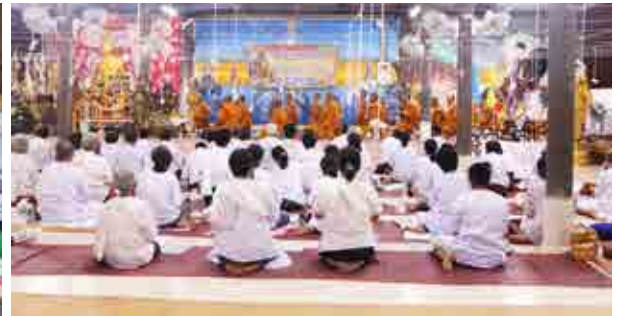
โครงการพระธรรมทูตส่งเสริมจริยธรรมชุมชน