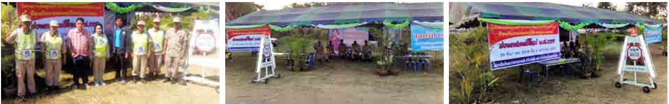
โครงการจัดตั้งศูนย์อำนวยความสะดวกความปลอดภัยทางถนน (เพื่อป้องกันและลดอุบัติเหตุทางถนนในช่วงเทศกาลปีใหม่ พ.ศ. 2559)