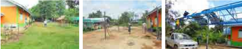
โครงการต่อเติมหรือตัดแปลงโครงหลังคา อาคารศูนย์พัฒนาเด็กเล็ก บ้านหนองใหญ่ หมู่ที่ 14