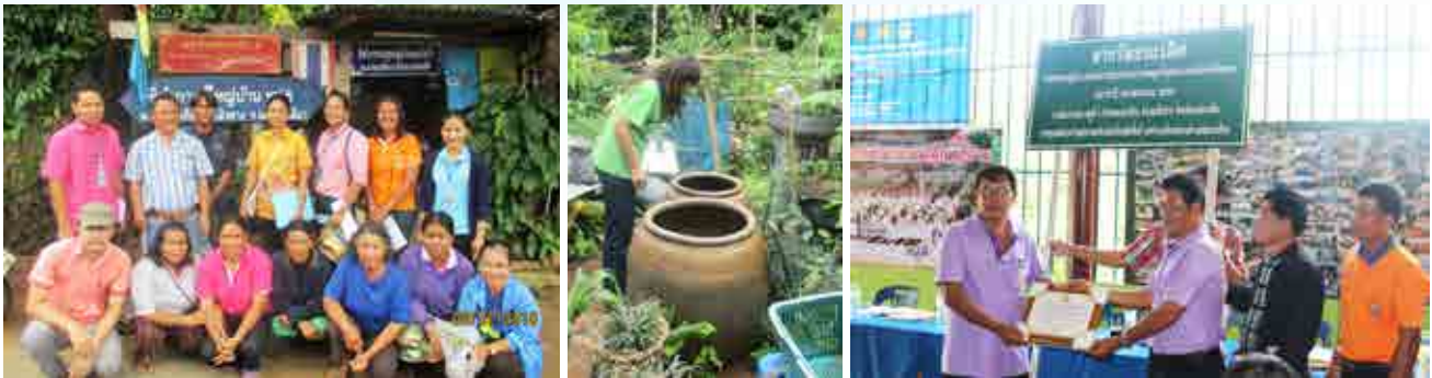
โครงการชุมชนสะอาด ปลอดภัยน้ำขุ่นหาย ป้องกันโรคไข้เลือดออก