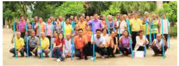
โครงการฟิตเนสสำหรับผู้สูงอายุและสิทธิสวัสดิการจากภาครัฐ