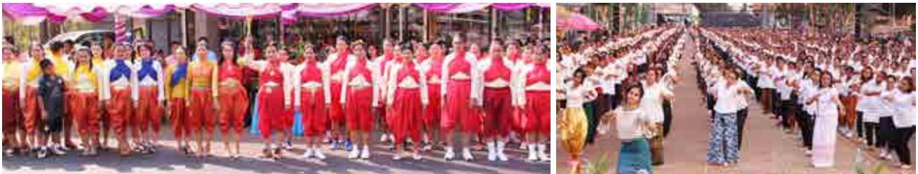
โครงการสตูดิโอวิกรมท่านท้าวสุนาริ ประจำปี 2559