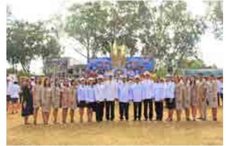
วันพ่อแห่งชาติ