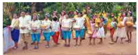
โครงการสืบสานประเพณีเข้าพรรษา