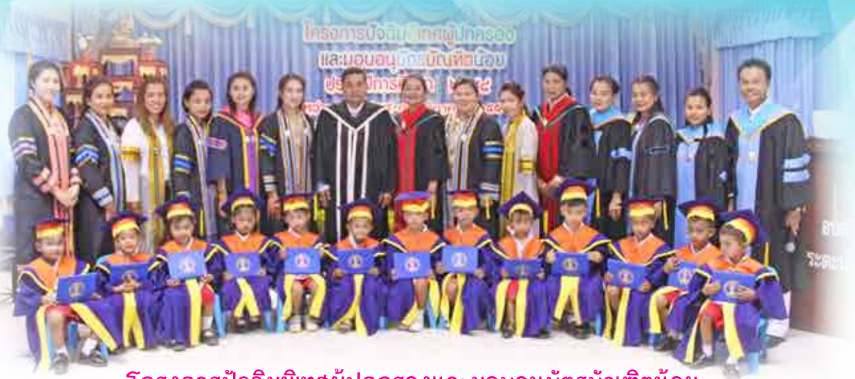
โครงการปัจฉิมนิเทศผู้ปกครองและมอบอนุบัตรบัณฑิตน้อย