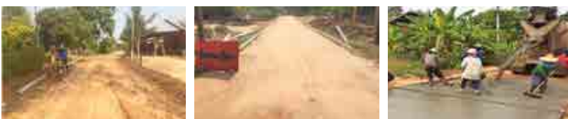
โครงการก่อสร้างถนนคอนกรีตเสริมเหล็กบ้านหนองไข่น้ำ หมู่ที่ 5