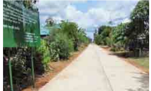
โครงการก่อสร้างถนนคอนกรีตเสริมเหล็กบ้านสันติมิตร หมู่ที่ 11