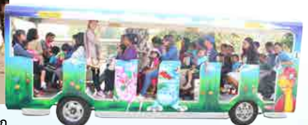
โครงการส่งเสริมพัฒนาการผ่านสื่อธรรมชาติศูนย์พัฒนาเด็กเล็ก