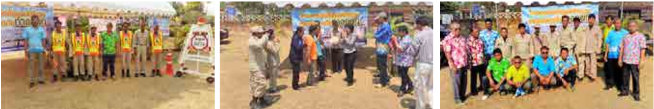
โครงการจัดตั้งศูนย์อำนวยความสะดวกความปลอดภัยทางถนน (เพื่อป้องกันและลดอุบัติเหตุทางถนนในช่วงเทศกาลสงกรานต์ พ.ศ. 2559)