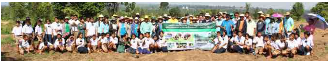
โครงการรักน้ำ รักป่า รักแผ่นดิน (ปลูกต้นไม้และหญ้าแฝกเฉลิมพระเกียรติ)