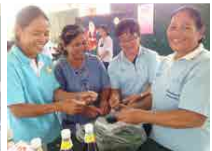
โครงการฝึกอบรมส่งเสริมอาชีพการแปรรูปอาหารกลุ่มสตรี

โครงการฝึกอบรม ส่งเสริมอาชีพการแปรรูป สมุนไพรกลุ่มผู้สูงอายุ