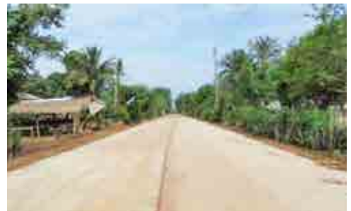
โครงการก่อสร้างถนนคอนกรีตเสริมเหล็กบ้านหนองใหญ่ หมู่ที่ 12