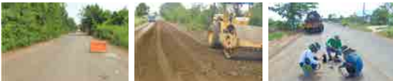
โครงการซ่อมแซมถนนลาดยางทางหลวงชนิตแควซีสล