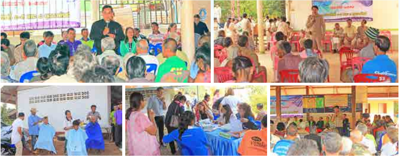
โครงการ อบต.สระตะเคียน พบปะประชาชน ประจำปีงบประมาณ 2559