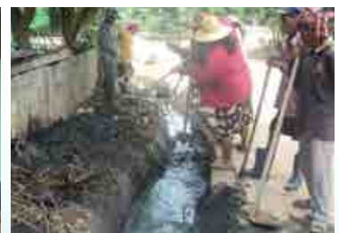
โครงการป้องกันและควบคุมโรคไข้เลือดออก