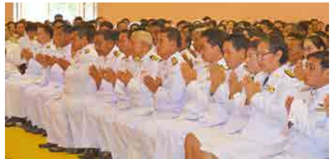
วันแม่แห่งชาติ