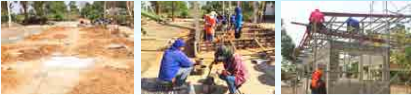
โครงการก่อสร้างอาคารสำนักงานอบต.สระตะเคียน