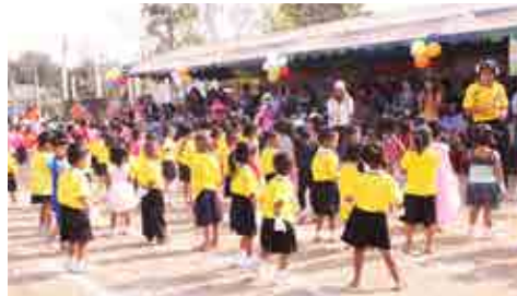
โครงการประเมินพัฒนาการองค์รวม ศูนย์พัฒนาเด็กเล็ก