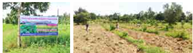
โครงการแปลงสาธิตการใช้ปุ๋ยพืชสดในการบำรุงดิน ศูนย์บริการถ่ายทอดเทคโนโลยีการเกษตร ประจำตำบลสระตะเคียน