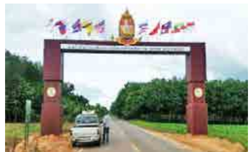
โครงการก่อสร้างซุ้มประตูทางเข้าบ้านโคกสูง-บึงบัว