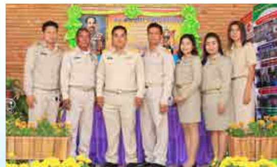
วันท้องถิ่นไทย