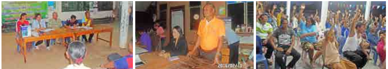
โครงการจัดประชุมประชาคมหมู่บ้านและตำบล