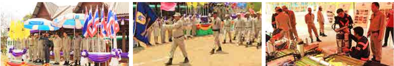
โครงการชุมชนสวนสนามและบำเพ็ญประโยชน์ เนื่องในวัน อปพร.