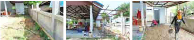
โครงการต่อเติมหรือตัดแปลงศาลาประชาคม บ้านโคกสูง หมู่ที่ 3