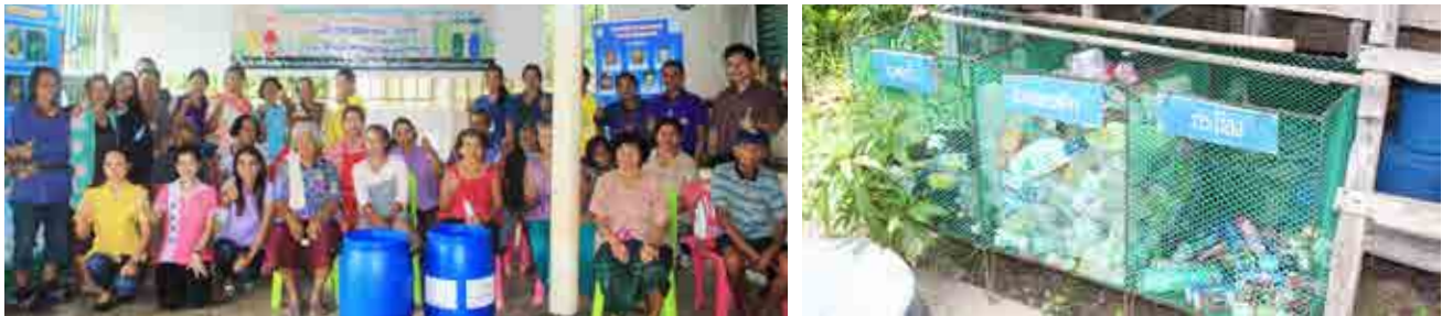
โครงการชุมชนต้นแบบการจัดการขยะ