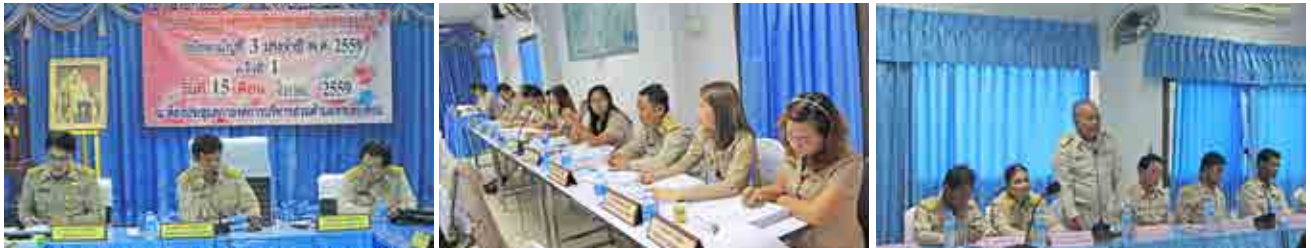
การประชุมสภา อบต.สระตะเคียน