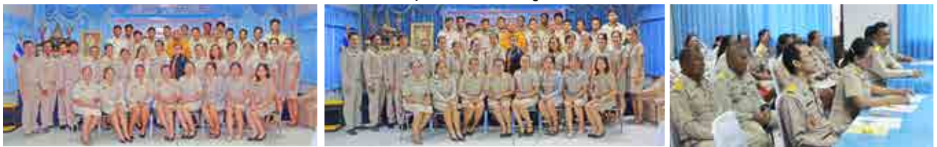
โครงการฝึกอบรมสัมมนาเสริมสร้างคุณธรรม จริยธรรม