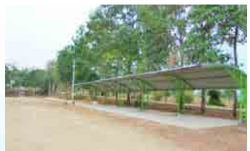
โครงการก่อสร้างโรงจอดรถ อบต.สระตะเคียน