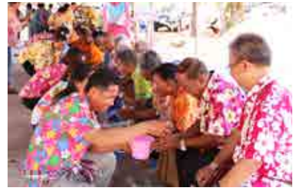
โครงการประเพณีสงกรานต์สืบสานวัฒนธรรม